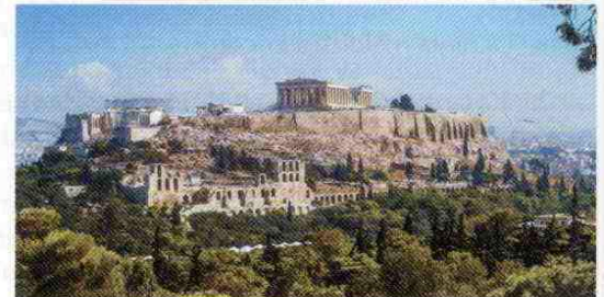
Acrópolis de Atenas.