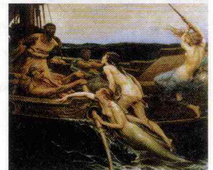
Herbert James Draper. Ulises y las Sirenas . (1909).