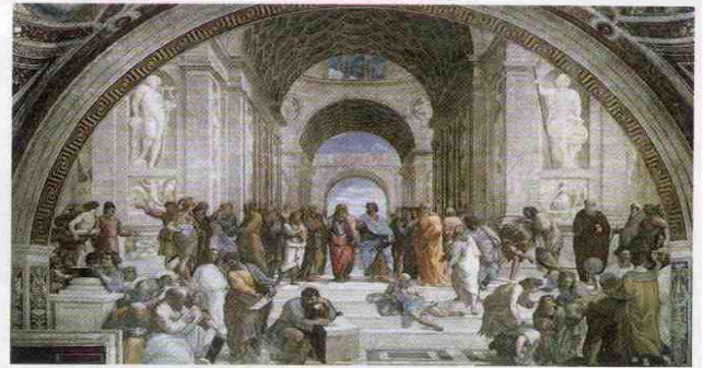
Rafael Sanzio. La escuela de Atenas (1510-1511).